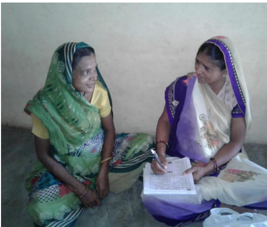
Jatan Project(improve mental health)