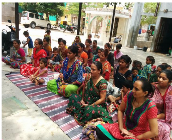
Tapovan Project(mental and spiritual care)

પ્લેટફોર્મ પરના અહીંયાં ચાઇલ્ડ હેલ્થ ડેસ્ક નિરાધાર, ગુપ્ત બંધેલ બાળકોને ન્યાય આપી શકશે. સેલ તંત્ર દ્વારા ચાઇલ્ડ હેલ્થ ડેસ્ક દ્વારા બાળકોને મદદરૂપ થવાનો અને પૂરો સહયોગ આપવાની ખાતરી આપવામાં આવી હતી. પીઆઈ યાદવે તેમજ સંબાલ ટિબુબાઈ પરિ સુધી ડરરોજ આણંદ રેલવે સ્ટેશનના વિવિધ કાર્યો કર્યું હતું.